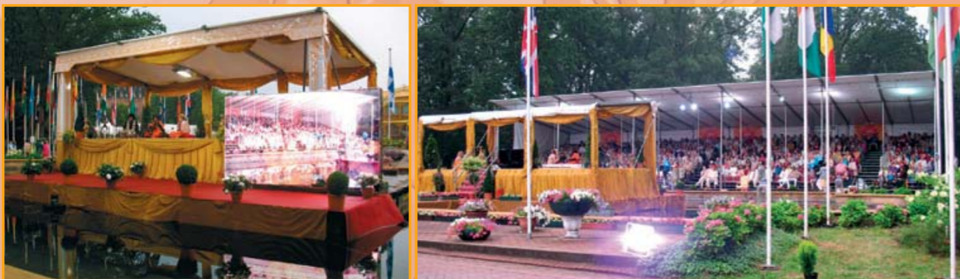
Fotos von dem Maharishi Gandharva Veda Konzert Guru Purnima 2010, an der MERU, Holland

Zeitplan: Vegetarisches Buffet: 18:30 • Konzert: 20:00